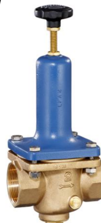
DN 32 - DN 50