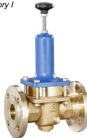
DN 32 - DN 50