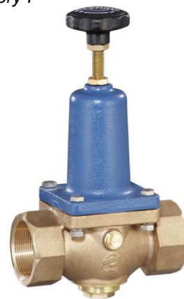
DN 40 - DN 50 (DRV 302-6)