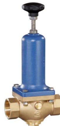
DN 40 - DN 50