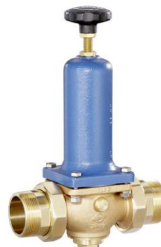
DN 40 - DN 65