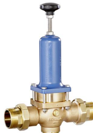
DN 40 - DN 65