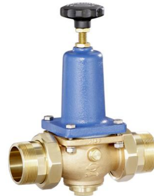
DN 40 - DN 65 (DRV 402-6)