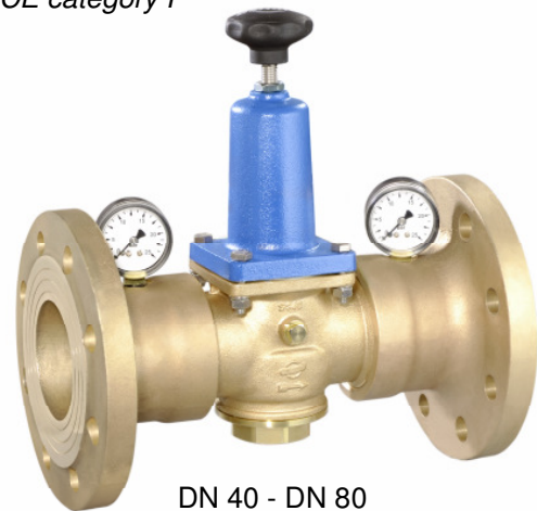
DN 40 - DN 80 (Ausführung / design DN 80)