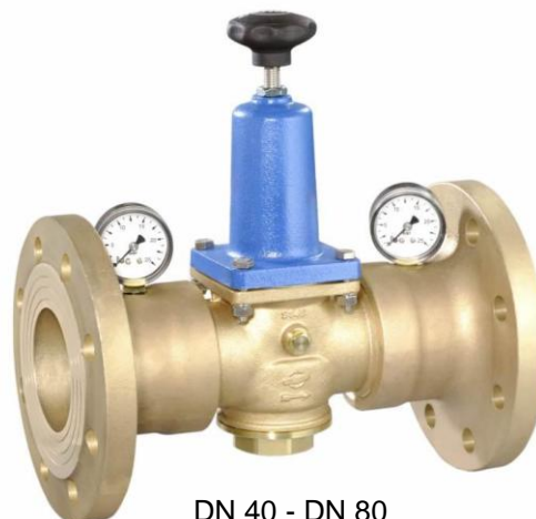
DN 40 - DN 80 (provedení / design DN 80)