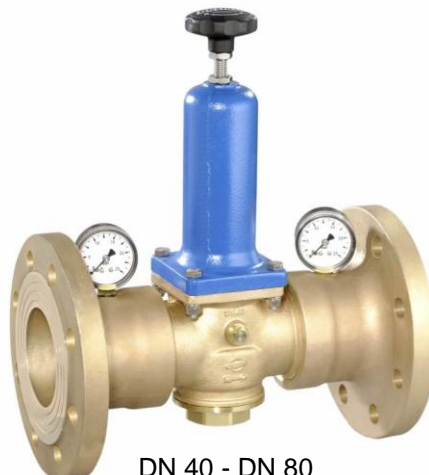
DN 40 - DN 80 (provedení / design DN 80)